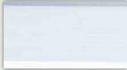
011-1002 İpek Mat Beyaz