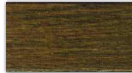
013-0265 Zeytin Yeşili