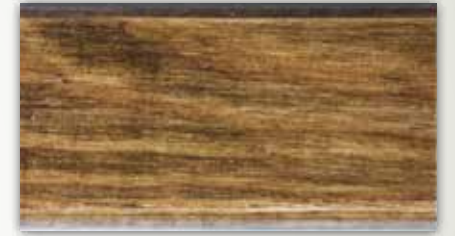
013-6010 A. Klasik Ceviz