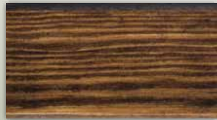
013-0251 Koyu Meşe