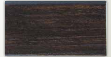
013-0290 Tria Kahve